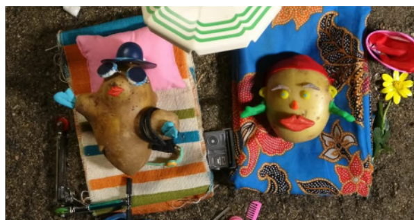
Les héroïnes qui expliquent les principes de la SSA

Après plusieurs mois de travail en collaboration entre Caméra au poing et une dizaine de personnes du Comité citoyen, le documentaire sur l'initiative locale est terminé. Projeté mi-avril au Paradis Païen à Castet d'Aleu et au cinéma Max Linder de St-Girons, le film va poursuivre sa route dans les salles d'Ariège. En attendant il est possible de le voir sur la Télé-buissonnière via le lien : https://tele-buissonniere.org/video/patates-chaudes/