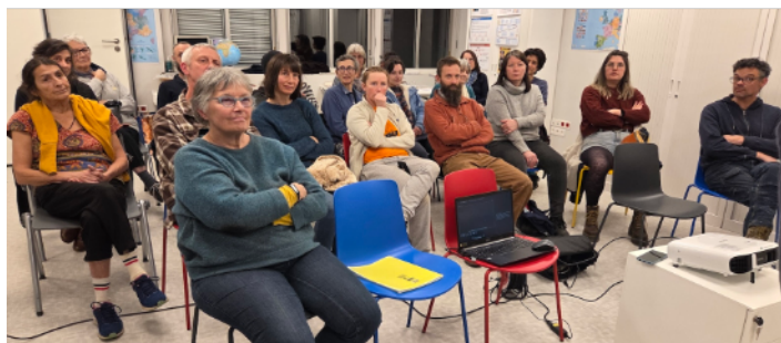
L'assemblée écoutant la présentation de la Collégiale

Le 12 février malgré une météo fort peu clémente, une vingtaine de personnes ont participé à la réunion pour partager entre participants de la caisse et producteurs / transformateurs / distributeurs. Après une présentation des avancées de la caisse par la collégiale, les participants à la rencontre ont réfléchi aux possibilités d'amélioration du conventionnement et de l'accessibilité, ainsi qu'aux liens qui peuvent être créés entre tous les acteurs de l'initiative SSA locale. La soirée s'est terminée autour d'un buffet concocté avec des produits conventionnés.